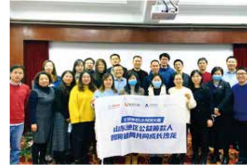
公益筹款 Leader 营培育计划