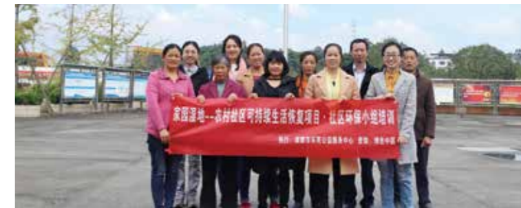
“成都家园湿地”项目