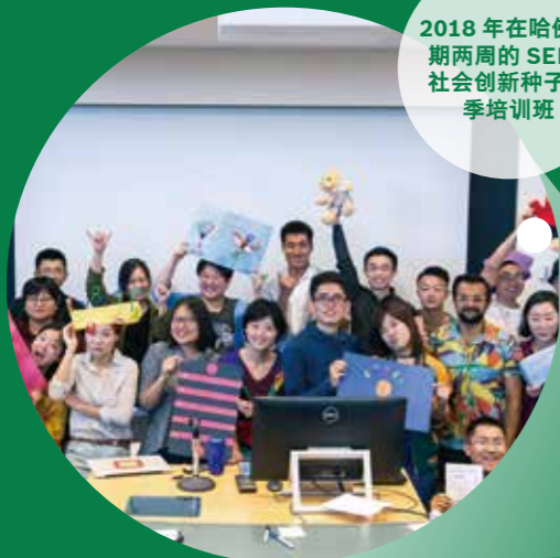
2018年在哈佛为期两周的SEED社会创新种子夏季培训班

而博世中国如同一双温暖的大手，或立于一旁鼓掌喝彩，或慷慨相助一把。但“大人们”深知，只有当青年发展的项目回归青年，才算正道。这双大手，也早已做好准备给予森林更明亮的世界，让她连绵不断，郁郁成荫。