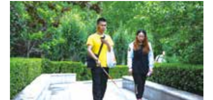
金盲杖·视障大学生校园融入支持计划