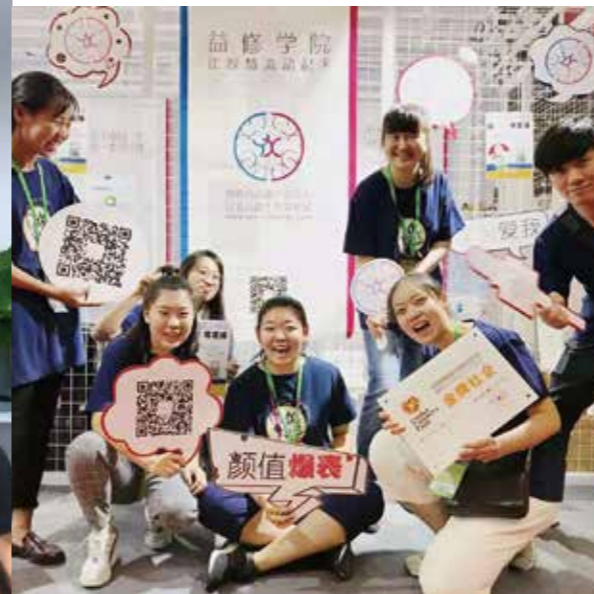
“博世益修学院”项目