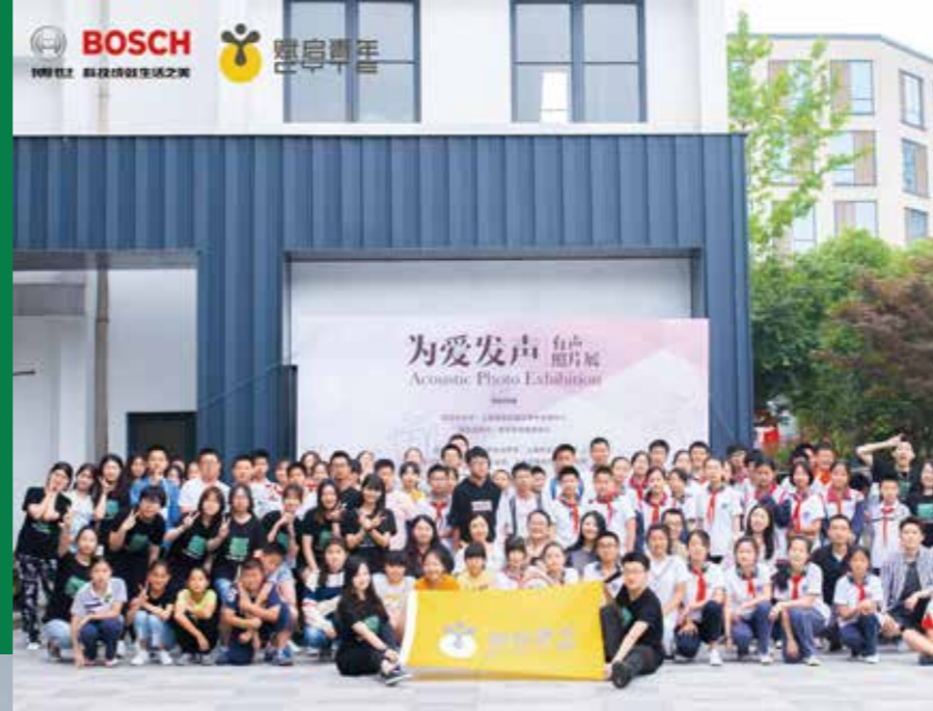
为爱发声——随迁子女社会融入与发展计划